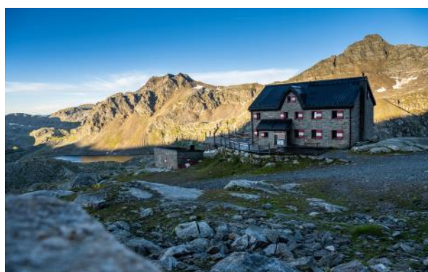
Sommer 2021: Wieder Normalität für die Alpenvereinshöhlen?

dergeben soll, geht im Spätsommer an den Start. Die „MALLNITZER WANDERWOCHEN“ werden dabei das Thema Mobilität (Anreise, vor Ort und Abreise) genauso aufgreifen wie die Zusammenarbeit mit lokalen Betrieben und die Verbindung von Berg- und Taltourismus . Zwar bleibt auch hier ein gewisses Risiko, ob und wie die dann herrschende Pandemielage ein solches Angebot zulassen wird. Nichtsdestotrotz bitten wir aber insbesondere die deutschen Alpenvereinssektionen, bei ihren Mitgliedern Werbung für dieses Angebot zu machen und so bei diesem Pilotprojekt mitzuwirken. Denn ein Anliegen ist auch, eine höhere Bindung und Identifikation mit der Alpenregion zu schaffen, in der unsere Sektionen ihre Arbeitsgebiete haben, um so auch mehr Potenzial und Interesse an ehrenamtlicher Arbeit zu wecken. Die Woche A ist vom 28.08.-04.09., die Woche B vom 04.-11.09.2021 geplant. Das Programm wird aus (Halb-) Tagestouren sowie einer Hochgebirgstour am Tauernhöhenweg mit Hüttenübernachtung bestehen. Weniger der alpine Anspruch, sondern mehr der Genuss des Wanderns werden im Vordergrund stehen.