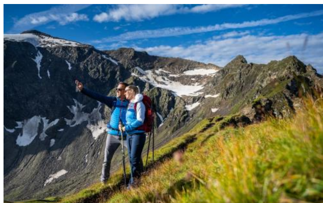
... und steht den Verbandsmitgliedern kostenfrei zur Verfügung!

Der VORSTAND wird sich am 05.03.2021 zu seiner nächsten Sitzung zusammenfinden. Hoffen wir, dass sich bis dahin schon eine Entspannung der Corona-Situation abzeichnen wird, um einen positiven Ausblick auf den Bergsommer vornehmen zu können. Wir freuen uns über Fragen, Anregungen und Themen für die kommende Sitzung. Kontakt: interessenverband@tauernhoehenweg.at oder .de