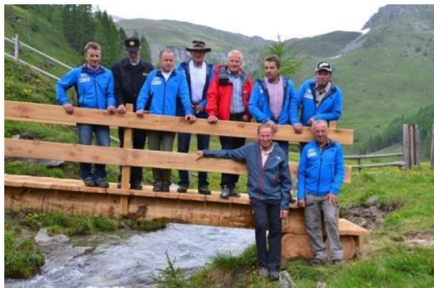
Neu im Verband: Team der Sektion Großkirchheim-Heiligenblut

Liebe Verbandsmitglieder, liebe Freundinnen und Freunde des Tauernhöhenwegs,