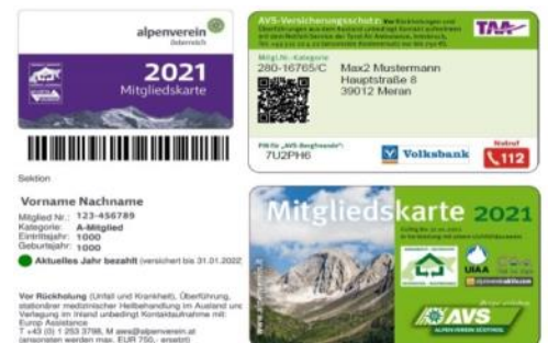
Digitalausweise von ÖAV und AVS 3

Auch der Bergsommer 2021 ist geprägt von der CORONA-VIRUS-PANDEMIE , auch wenn sich die Anzahl der Neuinfektionen aktuell auf einem niedrigen Niveau befindet. Dennoch steigen die Zahlen seit Beginn der Urlaubszeit nahezu überall wieder an. Umso wichtiger ist die Beachtung des Hygieneregeln , um eine vierte Pandemiewelle im Herbst zu vermeiden, sie zumindest aber beherrschbar zu halten. Da die Maßnahmen zur Eindämmung der Pandemie abhängig vom Infektionsgeschehen sind, sind besonders auch Reisende gefordert, sich sorgfältig über die jeweils geltenden Regeln zu informieren und