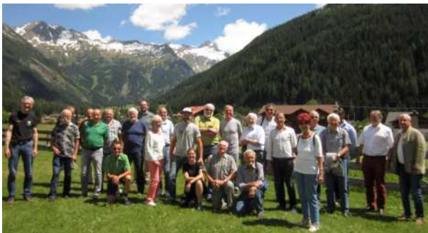
Mitgliederversammlung in Mallnitz. 1