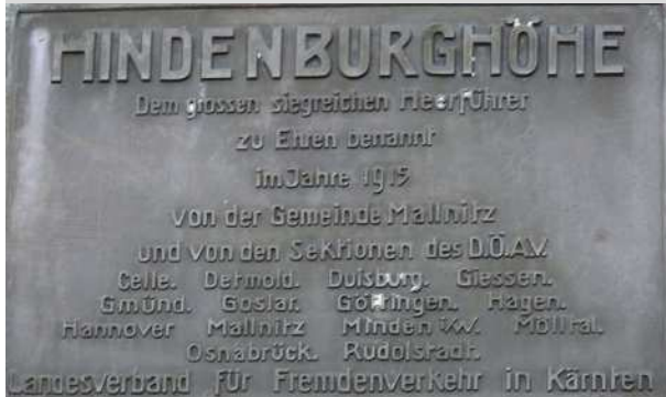
Die Tafel zeigt auch die Beteiligung der Sektionen. 5

Die HINDENBURGHÖHE ist nicht nur ein markanter Aussichtspunkt am Tauernhöhenweg. Sie ist mit ihrem Monument auch äußerst umstritten und genießt nicht zuletzt auch deswegen einen entsprechenden Bekanntheitsgrad. Aufgrund der Rolle Hindenburgs als Reichspräsident des Deutschen Reichs bei der nationalsozialistischen Machtübernahme waren auch immer wieder Forderungen lautgeworden, das Monument zu entfernen . Nunmehr wird die Idee verfolgt, die Stätte als Mahnmal zu erhalten und hier über die historischen Zusammenhänge und Folgen zu informieren . So soll hier auch über die Rolle des Widerstands in Kärnten gegen das NS-Regime informiert werden. Der Interessenverband hat sich diesem Ansinnen angeschlossen und will an der Verwirklichung dieser Idee mitwirken. Denn sie stellt auch eine Auseinandersetzung mit der Geschichte der Alpenvereinssektionen in dieser Epoche dar.